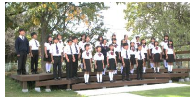
◎ 除幕式（上）と金管バンド・合唱団の発表（下）の様子